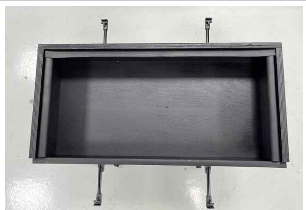
<사진2> 한국소비자원 제작 검은색 상자