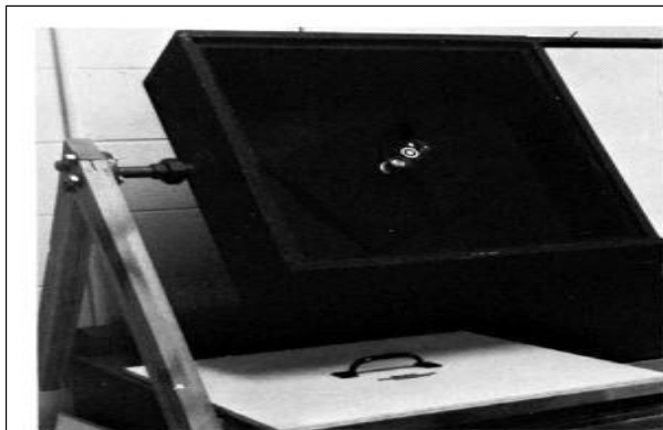
FIG. 1 Typical Unit with Pyranometer Mounted in Black Box

* ASTM E424-71 Standard Test Methods for Solar Energy Transmittance and Reflectance (terrestrial) of Sheet Materials 준용