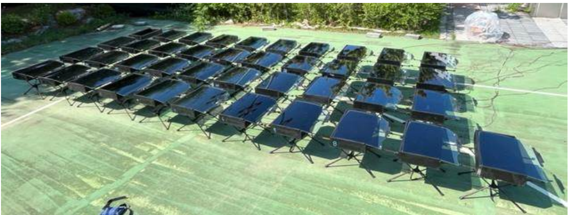
<사진 3> 태양열 차단 성능 시험