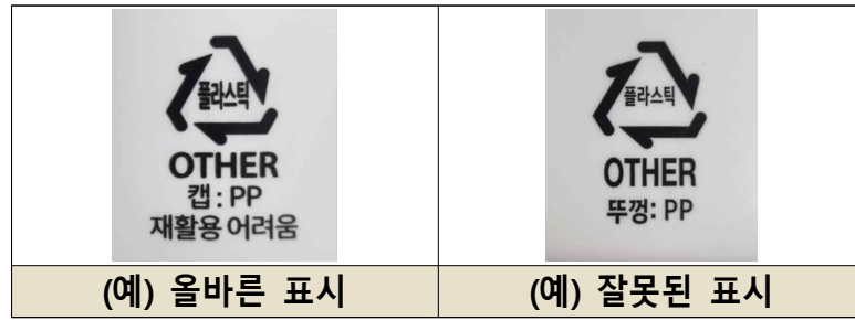
[ '재활용 어려움' 등급 표시 예시 ]

○ 제품 포장재의 재활용 용이성 등급을 확인한 결과, 5개 제품이 '우수', 4개 제품이 '보통', 1개 제품이 '어려움' 등급임.